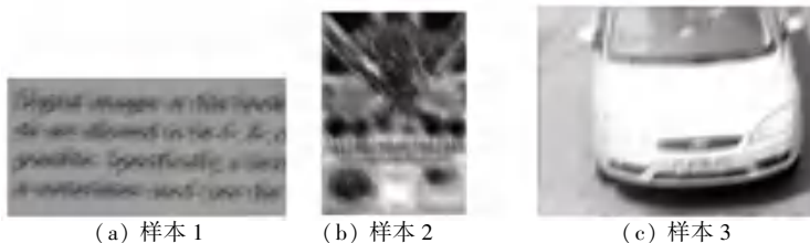
图1 退化图像典型样本

为一个基础且重要的底层计算机视觉问题,图像复原有很多经典的理论和使用方法,早期的逆滤波从频域的角度分析图像复原,基于扩散的偏微分方程和小波系数的统计特性推动了图像复原的发展;稀疏表示和字典学习在图像复原方面也取得了较大的成功。近年来,随着机器学习的快速发展,基于自然图像块建模的复原方法成为研究的热点 [2] 。本文针对图1所示样本类型进行图像复原算法的研究。